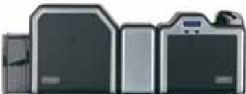
Impresora/codificadora dual con opción de laminación

El diseño modular crece junto con sus necesidades. ¿No está seguro de lo que requerirán sus aplicaciones de tarjetas de identificación en el futuro? Esto no es un problema. El modelo HDP5000 se actualiza fácilmente para adaptarse a sus necesidades. Empezar por una unidad básica de una sola cara. Instale los módulos de codificación. Actualice a una impresión dual. Agregue laminación sencilla o una laminación dual simultánea para lograr lo más moderno en cuanto a seguridad y durabilidad de las tarjetas.