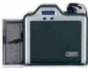
Impresora/codificadora de una sola cara

Las tarjetas de alta definición brindan la mejor calidad de imagen con la más alta funcionalidad. La película HDP se fusiona con la superficie de las tarjetas inteligentes y de proximidad, ajustándose a los relieves que se forman en las tarjetas con chip incrustado.